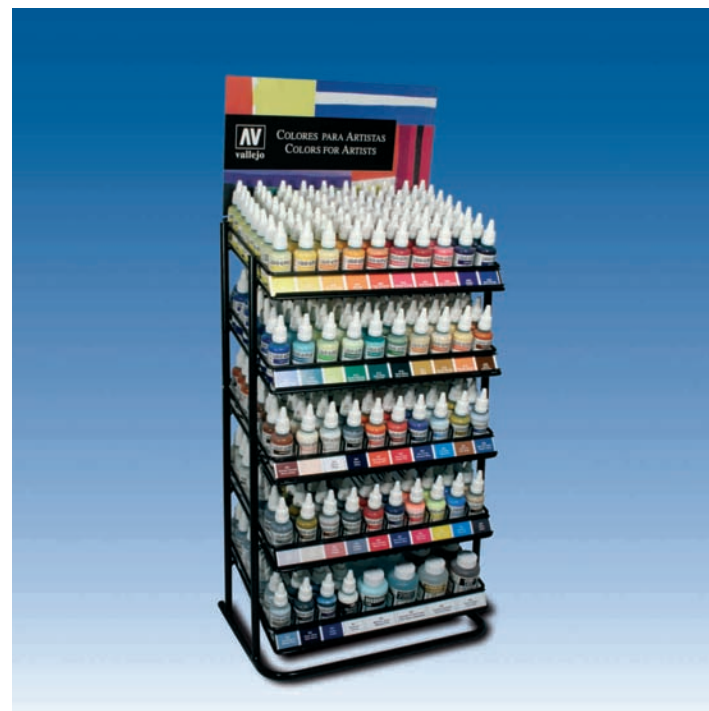
Expositor/display Liquid Acrylic 85X40X25,5 cm.

Pour plus d'information à propos des pigments utilisés et pour toute information technique sur l'aérogaphie, veuillez consulter notre web www.acrylicosvallejo.com .